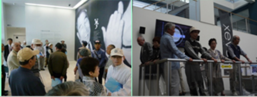
大和ハウス工業㈱記念館・ミュージアム見学・免震体験