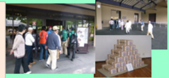
麵 作 り 研 修