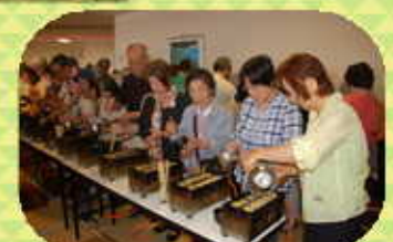
明石焼き体験:昼食