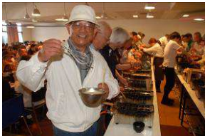
明石焼き工房での体験

た。やや場所が窮屈でしたが会員の皆様も和気あいあいと時間を過ごす事が出来ました。