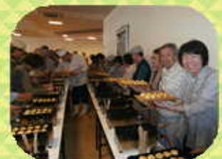
明石焼き体験：昼食