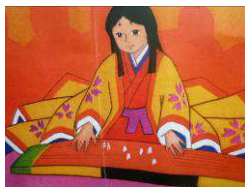
嫁くらべの初瀬姫

鉢は紙のように空へ舞い上がっていきました。その鉢の中から澤山の金や着物宝物が山のように出てきました。「まあ!これは亡くなった母(照美の方)のおくり物なのです」と言いました。