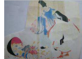
鉢の中からの宝物

早速身支度を整えて「嫁くらべ」の場にのぞみました。その姿を見た者は姫の姿だけでなく琴をひかせ