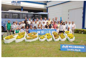
三ツ矢サイダーミュージアム(2号車)

当日は、バス2台・参加者83名で明石市にありますアサヒ飲料様明石工場へ向けて出発しました。