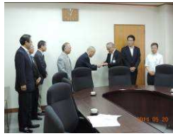
市役所にて目録贈呈

現在、支部社会貢献活動は市内 8ヶ所の公園と 4 駅前清掃活動、プルタブ収集を換金し市内の福祉施設に備品を贈呈する二つの活動をしています。先般、5月20日プルタブ換金の浄財で備品を購入、寝屋川市を通じて市内の「