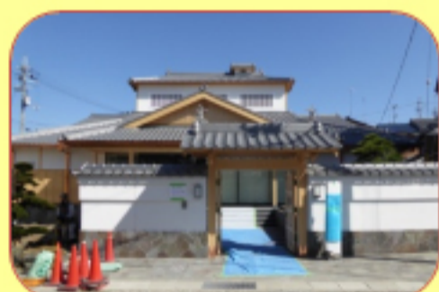
真田ミュージアム