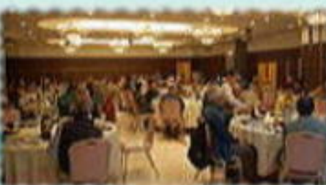
楽しくランチタイム