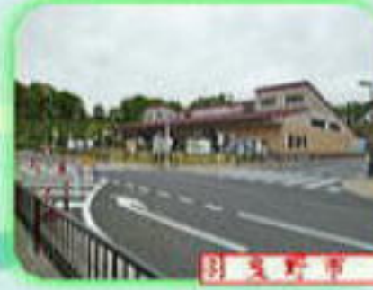
3 寝屋川 道の駅しらとりの駅