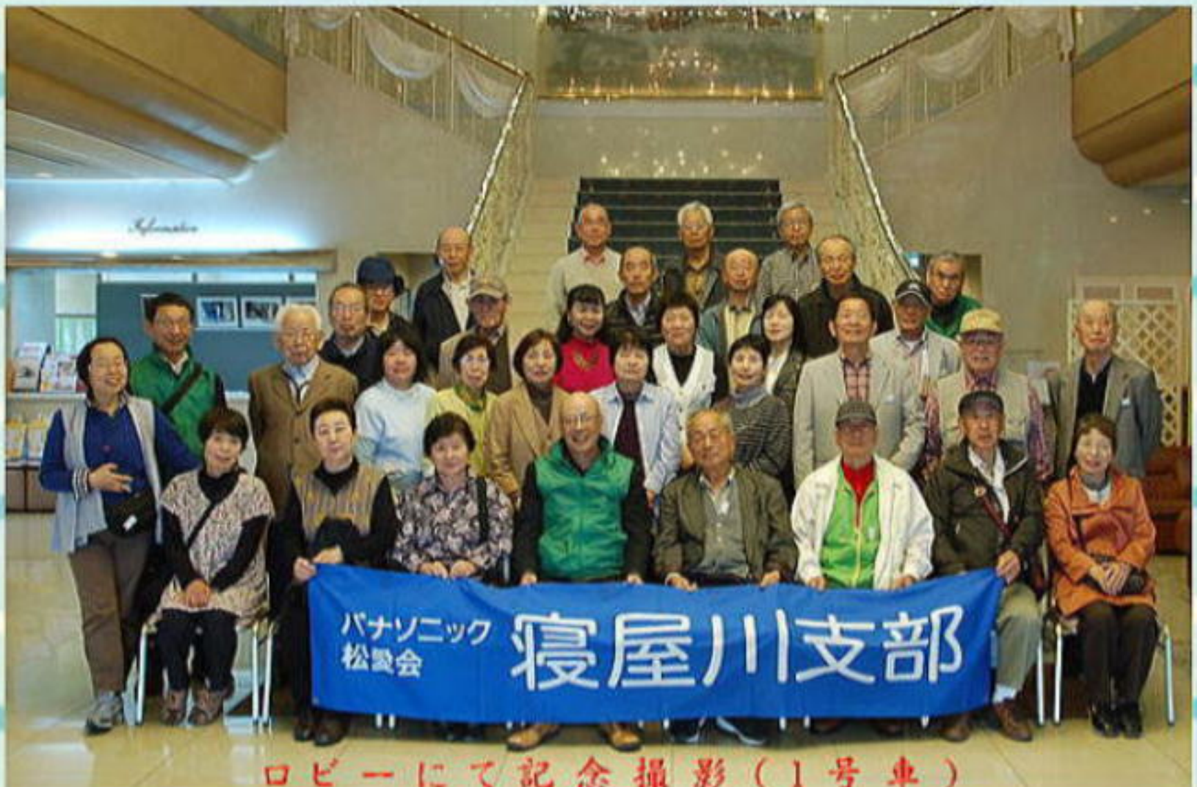
ロビーにて記念撮影(1号車)