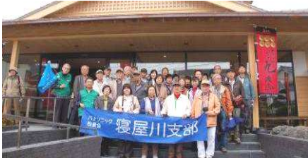
真田ミュージアムにて

その後は、九度山「道の駅柿の里」に立ち寄り産地の果物や土産品等の買い物を楽しみました。