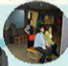
岩出市民族資料館