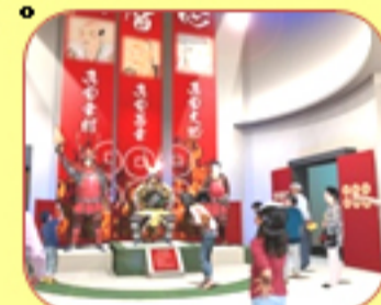
真田ミュージアム室内