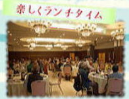
楽しくランチタイム