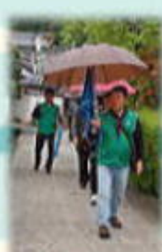
九度山町内散策中