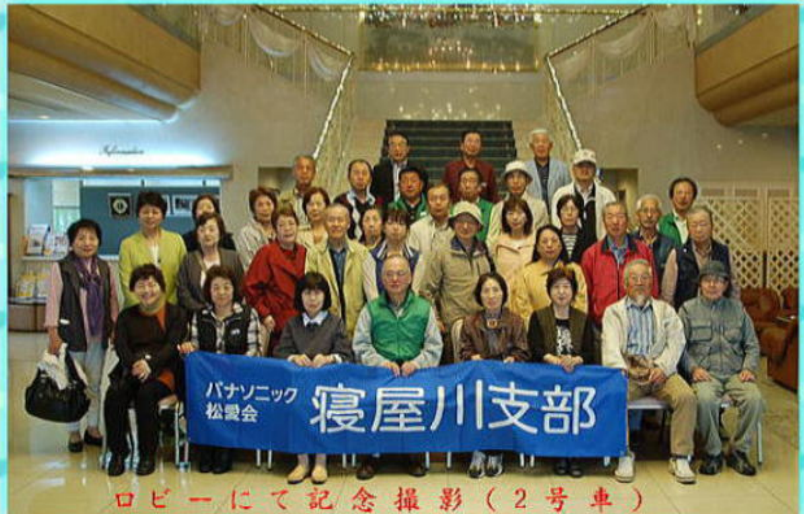
パナソニック 松愛会 寝屋川支部