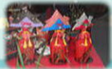
地場産お土産の品定め