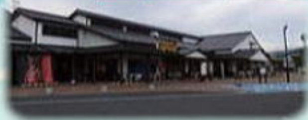
九度山道の駅特の棚