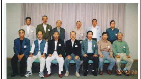
第13回新会員懇談会集合写真

今回は、「4. 新会員懇談会 1/2」掲載の2003年9月28日実施第13回新会員懇談会の集合写真で新たな写真提供があり、以下の通り掲載します。