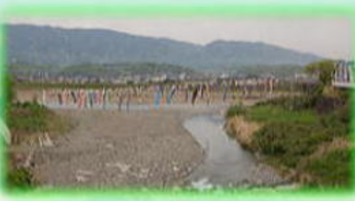
九度山 真田ミュージアムへ