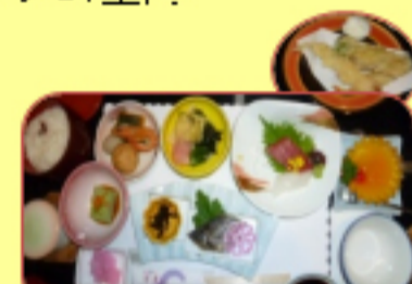
ホテルいとう：昼食