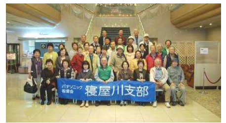
昼食を摂った「ホテルいとう」

午後からは雨模様ながら最終目的地の新義真言宗総本山「根来寺」を拝観して境内を見学しました。