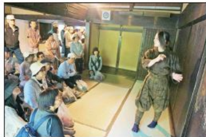
〔忍者博物館で解説を聞く〕

恒例の支部行事 楽・遊 ねやの会（春）が晴天の5月24日（木）に開催され参加者67名がバス2台で八坂公民館向かいより、最初の立ち寄り地「伊賀流忍者博物館・上野城」に向け出発しました。春の行楽シーズンの中、高速道路 他も大きな渋滞も無くほぼ予定通り上野公園に到着しました。