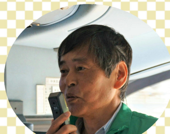
車輛長:大貴支部役員