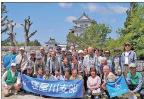
〔伊賀上野城にて（2号車）〕

早速、号車別に忍者博物館に向い館内の、どんでん返し、隠し戸、刀隠し等の解説をくノ一（女忍者）から説明を受け博物館の見学を行いました。続いて新緑の上野公園内の城代屋敷台所門跡で集合写真の撮影を行な