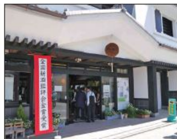
〔若戎酒造で試飲・買物〕

を見学しました。続いてお楽しみの昼食場所である「日本料理 伊勢之家」に向い、麦酒やジュースで乾杯の後、皆さん懐石弁当に舌鼓を打ちながら暫し歓談をしておられました。午後からは、1853年藤堂藩より印札を受けた伊賀の酒蔵「若戎酒造」を訪ね試飲や買物を楽しみ、