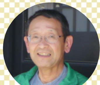
車輛責任者:北口支部長 車輛長:池田支部役員