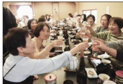
〔お楽しみの昼食で乾杯！〕

い上野城へ向いました。お城へは階段を登り入城後1階・2階に展示されている、藤堂高虎愛用の甲冑や刀剣等と3階天守閣の絵天井にある横山大観の大色紙『満月』等