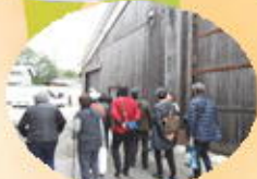
西山酒造見学・試飲