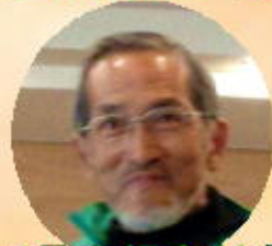
2号車柄責任者 北口支部長