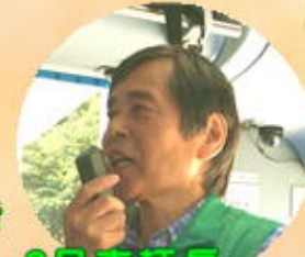
2号車柄長 大貫支部役員