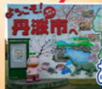
おばあちゃんの里