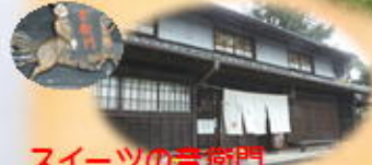
スイーツの音衛門