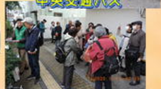
寝屋川八坂公民館前