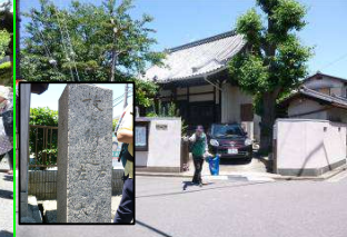
是三寺と大塚口道標