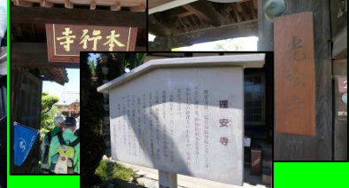
寺町(本行寺・光松寺・理安寺)