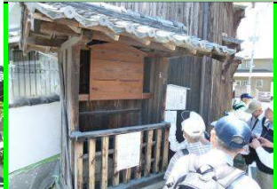
下田部高札場と道標