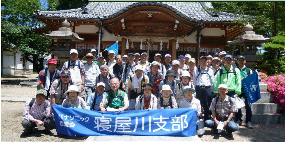
野見神社・永井神社にて