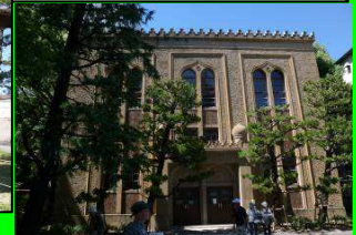
イラム様式アーチ