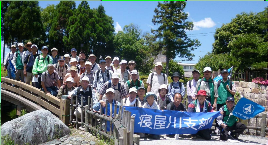
静かな城跡公園の太鼓橋にて