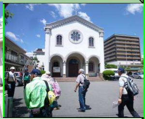
高山右近天主教会堂