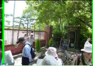
旧陸軍工兵隊哨兵所跡