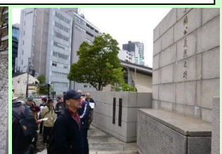
小楠公義戦之跡(解散)