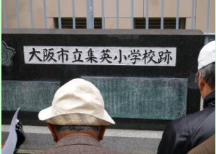
集英小学校(国民学校)跡