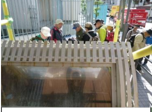
太閤下水 NHK[プラタモリ]の散策コースでも紹介されました