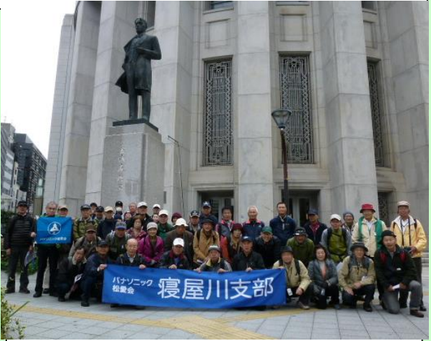
NHKドラマ「あさが来た」で脚光を浴びた五代友厚像前で