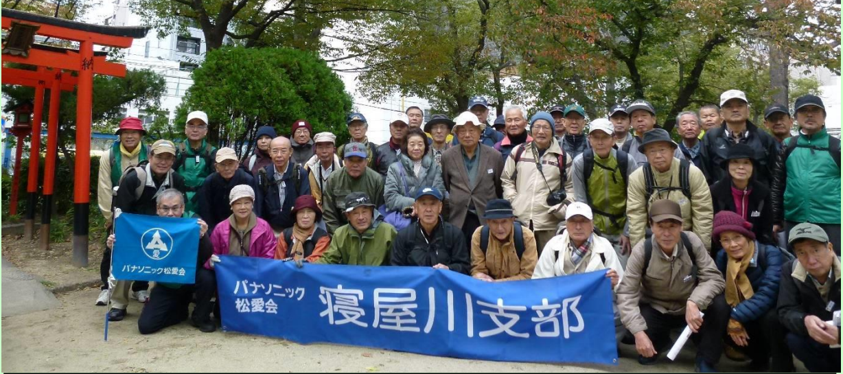
上町台地一角の南大江公園内にある朝日神明社にて記念写真。この後、南大江公園内で昼食を摂りました。