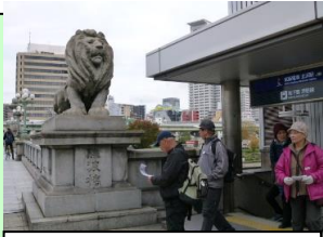
難波橋(北浜駅26番口すぐ)