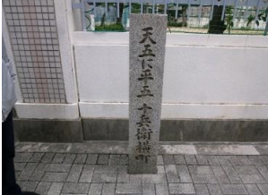
天五に平五・十兵衛横町跡