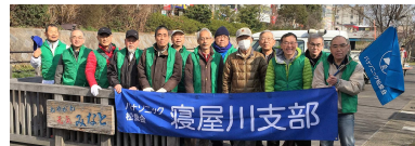
萱島駅(上)寝屋川市駅(下)参加者