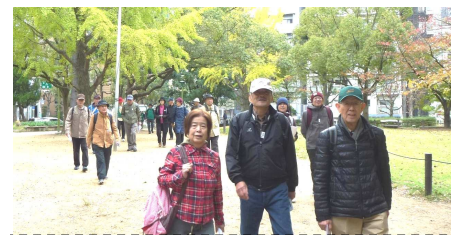
黄葉の北大江公園を散策

本町橋100年展示に見入るや近代に発達した大阪の歴史や文化に触れる事ができた散策となり、知っているようで意外と知らない地元大阪を再発見できた一日でした。