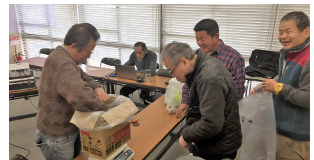
地区委員による収集・計量風景

ﾌﾙﾀﾌﾞ収集&計量・売却を1月7日(土)に実施しました。班毎に持ち寄ったﾌﾙﾀﾌﾞは合計57kgとなり、売却額は5,130円でした。