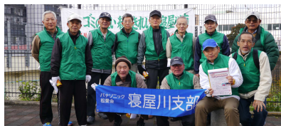
香里園駅(上)東寝屋川駅(下)参加者