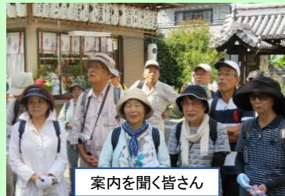
案内を聞く皆さん