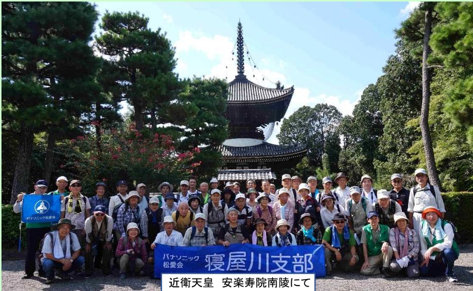
近衛天皇 安楽寿院南陵にて