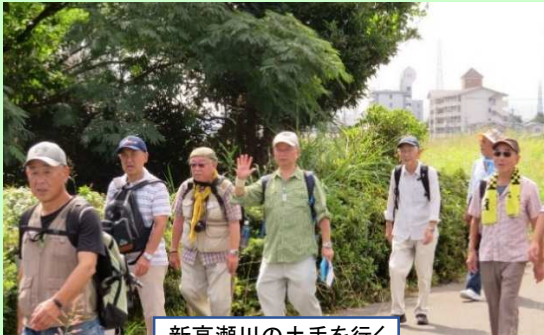
新高瀬川の土手を行く