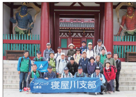
【四天王寺 仁王門にて】

最後は「庚申まいり」で知られる庚申堂、福祉事業施設の原点ともいわれる施行院などを経て、23名が完歩し天王寺駅にて解散しました。