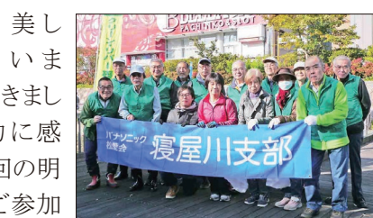
【せせらぎ公園参加の皆さん】

箇所には3名の合計29名の方のご参加をいただきました。約1時間半の草刈り、ゴミ拾いなどの清掃活動で、一汗流し、また一段と