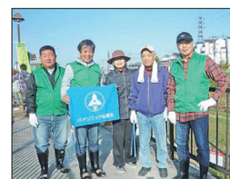
【川勝水辺広場参加の皆さん】

秋、爽やかな11月17日(日)、寝屋川市主催のクリーンリバーねや川作戦・秋が開催されました。清掃箇所