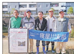
【幸町公園参加の皆さん】

箇所には3名の合計29名の方のご参加をいただきました。約1時間半の草刈り、ゴミ拾いなどの清掃活動で、一汗流し、また一段と