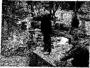
太鼓橋池にEM液投入!

一昨年五月発足以来足掛け三年に入り我が「EM寝屋川会」もレベルアップ向上期(EM活性液の作り方、使い方の応用等)が過ぎ、屋外に於ける周辺地域への活動展開へと移った昨今である。この間大阪浄化の会(道頓堀川浄化作戦の中心・NHKで放映)への参加、住吉大社太鼓橋池の浄化、神崎川浄化の会等へ活動の輪を広げてきました。残念ながら寝屋川市への再三のアプローチも不発に終わり、寝屋川浄化の貢献に至らず、今年こそはと、点野や寿町のドブ川浄化へ本格的な活動をする年と位置付けて張り切っています。このためには各家庭からのEM活性液の活用放流とEM寝屋川会のメンバー拡大が必要です。寝屋川支部の皆さん!積極的なご支援ご参加をお願い致します。 一緒に郷土寝屋川の環境浄化に取り組みボランティアの輪を広げ孫子の代に蛍の住む町にしましょう。 皆様のご応募お待ちしております。