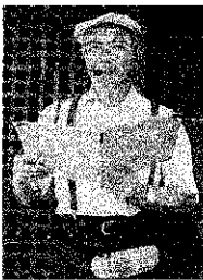
松下電器は昭和八年に大開町から門真へ拠点を移しました。鬼門(東北の方向)へ移動するのを嫌う風習は今でも存在しています。

松下電器は昭和八年に大開町から門真へ拠点を移しました。鬼門(東北の方向)へ移動するのを嫌う風習は今でも存在しています。古代の中国で発生した