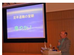
定年後の過ごし方 ユーモアのある話に 聞き入りました

本年もプロジェクトを活用し、活動の状況を写真やグラフで説明を実施し大変好評でありました。