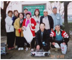
2003年当時の世話役一同

はじめは参加者10人前後で、体操を行うことが少し恥かしかつたのですが、毎日々々ただ健康の為に考えて頑張って体操を続けていると知らず知らずと同じ考えや気持ちの人が徐々に集まってきました。