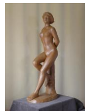
最新作 6月完成 「喜びの歌」 h=80cm

支部内には趣味や、色々な事に挑戦されている沢山の方がおられると思います。このコーナーで紹介をさせていただきます。自薦、他薦を問わず推薦をお願い致します。