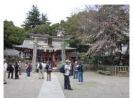
機物神社本殿を望む

機物神社では「棚機」(タナバタ)と書かれています。中国では七月七日を昔から「七夕」と言われていたので中国から渡来した漢字だと思います。