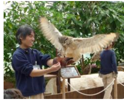
フクロウショー を楽しみました

バス2台で出発、阪神高速湾岸線を神戸に向い渋滞もなくポートアイランドにある神戸花鳥園に到着した。フクロウやミミズク、また沢山の鳥たちのショーや色鮮やかさに感激をした。