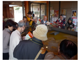
平城宮跡で説明を聞く

した影響などが充分に理解できた。当日は天気もよく修学旅行生も多く見かけ、外人と話をする体験のなか割り込んで話し出す会員さんもいた。大仏さんの花の大きさに切りぬいた柱穴をくぐる旅行生を見て昔の自分を思い出した会員も多かったのではないだろうか。名物の鹿がいたる所において餌をやる人について回り、