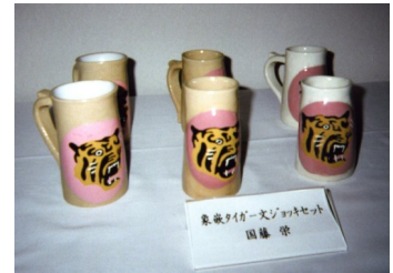
象嵌 タイガー文 ジョッキセット

いるのだから、陶芸部を創ったらどうか。当時松友会という部活組織があったので、仕事が終わったからの体育・文化活動が盛んとアドバイスされて創部。窯はセラミックスの研究者が手づくりで立派なも