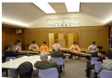
さわやかな琴の調べに聞き惚れる皆様

ました。家事全般をするようになったのもその頃からです。その間に孫が次々と5人生まれ、公私共に多忙であると共に大変充実した毎日です。今では料理のレシピも40種類を超え日々新たな生活で、日記は5行では足りなくなりました。