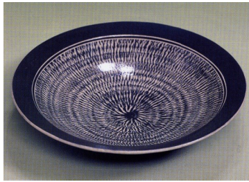
飛び鮑 大皿 径 39.2 高さ 8.8

そのある時、城阪所長（後副社長）から「ここはセラミックス（成形・焼成などの工程を経て得られる非金属・無機材料の総称）の研究をやっ