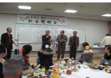
今年のラッキーな方々

グは関西外国語大学フラメンコ部「アンダハレオ」の十二名の皆様と大阪大学スペイン舞踊研究会「アルコンパス」六名の皆様によるコラボレーションでフラメンコをギターの生演奏と舞踊で一気