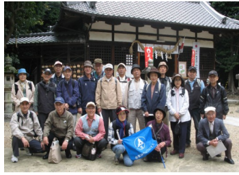
春日神社で集合写真

京阪電車交野線群津駅に集合し釈尊寺町より茄子作北、茄子作二丁目、三丁目と香里ヶ丘や山上四丁目目潜在する史跡10ヶ所を巡った。