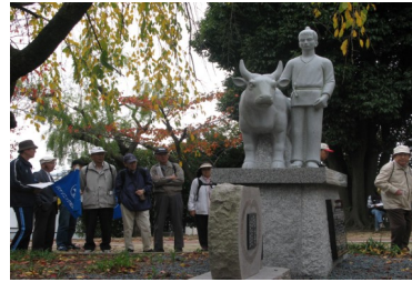
牽牛像に見入る参加者

今年暖かさが続き遅い紅葉であったが歴史に触れながら歩いた町並みのぶらり散策も、新鮮な一時であった。