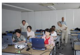
みんなが先生 教えあっています

パソコンの活用方法は無限にあるといっても過言ではないと思えます。その可能性を引き出し、楽しくパソコンと向き合えるよう、取り組んでいます。