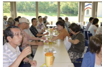
今回の楽しみはこれ!

第46回友呂岐会を7月22日に67名の参加で実施した。今回は、①健康講話②万博ピリオン入館③ビール工場の見学試験のコースでバス移動をした。