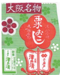
津の清の栗おこし

菅原道真公が九州大宰府へ赴く途中、大坂四天王寺に参拝し安居神社の近くで休憩された。住人は菓子師の「栗おこし」を献上したところ、たいそうお喜びになり道真公は菅原家の家紋(梅紋)の礼として与えられた。現在の大阪名物「梅紋」つき「栗おこし」の由来である。道真公はその後の河内の道明寺へ(伯母(寛寿尼)に、いとまぐいで訪れている。