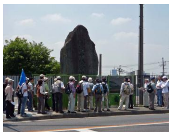
明治18年洪水碑の説明を聞く

京阪電鉄枚方公園駅に集合し、枚方市駅までの京阪線と淀川に囲まれた史跡16ヶ所を巡った。今回は江戸時代の京街道沿いの枚方宿の境界である西見附(守口側)く