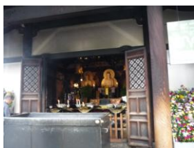
骨仏が祀られる 一心寺

栗おこしの元祖・津の清は、宝暦2年(一七五二)創業で店の前に「二ツ井戸」がある。そのうち