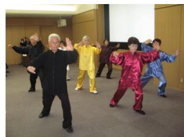
年次支部総会での演武

元氣サークル(太極拳)「太極拳元氣サークル」は平成10年に発足し、今年で13年になります。会員も、40名で年齢に関係なく、元氣なグループとして活動しています。「楊式太極拳」は、もともとは武道なのですが、その鍛錬法が「ゆったりとした動作と呼吸をもって、心と体の調和をはかり、全身の余計な力を抜いて、ゆっくりと動く」ということが武道的に大切で、それを守って練習すると、健康に驚くほど効果があり、いまでは、健康法として広まっています。元氣サークルの練習日は、水曜日と土曜日の週2回で、場所は保健福祉センターを利用して頂いています。