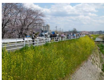
穂谷川三色空間の散策

近の神社遺跡等を巡り、穂谷川堤防の歩行者専用道を招堤方面へと移動。菜の花の黄、桜のピンク、晴天の青の三色に囲まれた空間の中を、心地よい春風を受けながらのんびりとした散策となった。