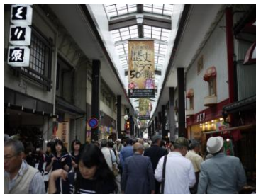
賑やかな黒壁スクエア

その後、滝で有名な養老公園内の豆馬亭にて昼食。出発まで新緑の中で休息を楽しんだ。