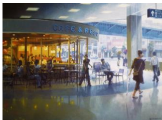
黄昏時のティータイム

大阪市立美術館で2月19日～3月21日まで開催されました。新入選全国で75点の中に入るといふ快挙です。作品名は「黄昏時のティータイム」と題して都会のひと時をカットした素晴らしき作品です。