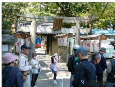
片埜神社東門付近

に初参加6名を含む44名十孫2名が集合し、枚方市内パート7のコースへと元気よく出発した。一日中天候に恵まれ、午前中は駅周辺の仏閣や遺跡、片埜神社等を巡った。片埜神社は河州一之宮の延喜式内社で、本殿は国の重要文化財、東門・南門・石造灯笼は府の文化財に指定されている。門には古い蛙股、灯笼には梵字が浮彫りされる等、河内地方の歴史や由緒が感じられた。