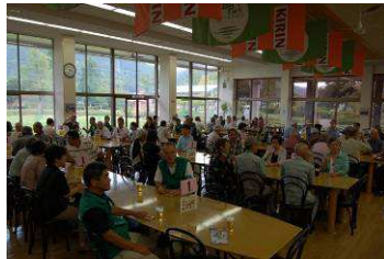
キリンビール岡山工場

最終の目的地、キリンビアパーク岡山工場では見学と試飲をさせて頂きました。美味しさの余り何杯もお代わりをされた方も居られました。