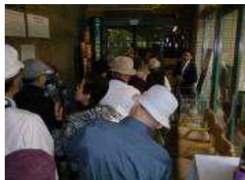
坂井氏の活動を学芸員から

鶴引揚記念館に向かいま した。この場所は、終戦 後に海外「特にシベリア」 の引揚者を戦後12年も の永きに亘って受入れさ れた港でありました。館 内では学芸員さんから、 熱情を込めた詳細な説明 を受け参加した会員が感 動した状況でした。