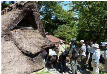
復元された弥生式住居跡

遺跡で発掘された弥生時代中期の堅穴住居跡をモデルに復元された茅葺き屋根の復元住居もあり、直径8・5m、高さ5mの内部に全員が入り、以外と広いが真っ暗な空間で弥生時代の住居体験をして、現代の灯りの有り難さを痛感した。