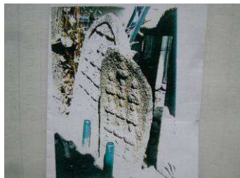
大念寺の十三仏板碑

堀溝・大念寺には、大小石があり、大きい方は高さ115cmで慶長十六年(1611)、小さい方は高さ90cmで、慶長十四年(1609)の年号が刻まれており、共に文化財に指定されている。