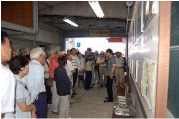
窯元の備前焼工程説明

主目的地の備前窯では責任者の方から備前焼が出来る迄の工程を説明頂き参加者の全員が感動されています。又、記念にと多くの方々が備前焼を購入されました。