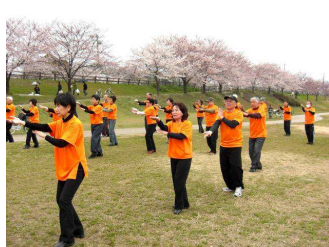
毎年4月のお花見太極拳

又「元氣サークル太極拳」は、年4回の行事を実施しています。2月は「新春演武会」で日頃の練習成果を披露すると共に新年会を行います。