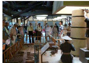
学芸員による鋳物工場解説

の旧田中家住宅では鋳物師の住宅内でむかし使われていた生活用具等を手取り、子供の頃の生活様式を懐かしんだ。