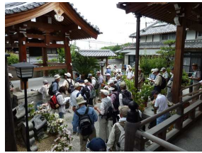
極楽寺での釣鐘解説

今回は寝屋川市内パート2のコースを三地域に分けて合計12箇所の史跡巡りとなった。初めは駅東部に広がる丘陵地方面、次に駅周辺部、最後に駅北東部方面の田植え直後の田圃の畦道を抜け駅北側の寝屋川公園内まで、約5kmの歴史散策となった。