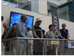
免震システムの体験

第51回友呂岐会が好天の中5月18日土曜日に開催されました。今回は阪奈探索と題しまして大和ハウス工業(株)様と(株)三輪そうめん山本様の工場見学と勉強会を中心に計画致しました。