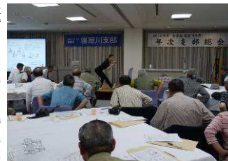
ロコモ対策セミナー

続いて北口地区委員からは新しい取り組みの「ウオーキングラリー」の説明が行われました。第2部の懇談会では、駅名ビ