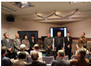
作品発表会で会員一同

○絵画同好会が発足し今年で10年です。「第10回作品展示会」を松心会館2階のギャラリーで11月2日〜9日迄開催予定です。