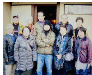
2013年新年会の皆さん

映像同好会は全国支部の中でも唯一の映像の同好会で昨年創立十周年を迎えました。メンバーは女性2名を含む8名が活躍しています。