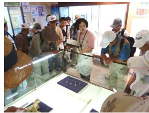
埋蔵文化財資料館見学

摂津・大阪市内等を一望し、涼風も受けて全員疲れや蒸し暑さも吹き飛ばす爽やかな気分になりました。駅周辺部へ戻って市立埋蔵文化財資料館・打上古墳群の石群等を見学すると駅周辺部が古代の大坂湾の渚部分に位置し、古からひらけた地域だった事が理解できた。