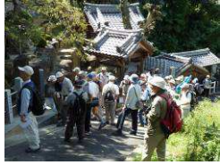
湯屋が谷弘法井戸

当日は台風20号の関東沖通過の影響で急な秋の深まりとなり最高気温が前日比で6℃も下がります。年並みの27℃となり晴天とも重なり絶好の散策日和となった。コースは約4kmで、香里園駅を起点に東南方向山手側の名所旧跡・神社仏閣9箇所をゆくりと訪ね歩いた。