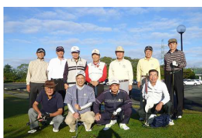
第34回コンペの皆さん

私達元氣サークル・グループはもともと仲間を増やし共に健康で元気に明るく太極拳を楽しみたいと考えています。皆様のご入会をお待ちしています。(現在はの会員さんは31名です)