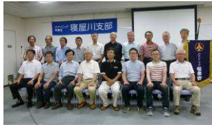
出席の新会員の皆さん

自己紹介の後、専門分野毎に担当地区委員から説明、昼食会では趣味やこれからやりたいこと等、新会員から披露があり、和やかなうちに終了しました。