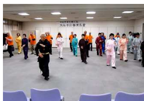
太極拳新春演武会

「太極拳元氣サークル」秋晴れの好天気恵ま同好会は発足15周年に成れ寝屋川球友会・第34回記念行事としてゴルフコンペを開催致しロゴ入りTシャツを作り、ました。前日は雨でしたが今秋ユニットピア篠山での無事に終了できました。合宿旅行で着用お披露目 また年3回開催ですが現地で太極拳を元気に今年3回目となりまして楽しみました。会員数は男15名、女性21名、計36名が、全員が和気あいあい名メンバーで毎週水曜と楽しむ事ができました。日と土曜日週2回「保健福祉センター」で心と体の健康を願ひ、練習を楽しんでいます。また年3回(冬・春・秋)に親睦行事を開催しています。