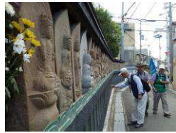
地蔵寺外壁石像群

又、5番目訪問の「聖母女学院」では、校門横の聖母マリア像やルルドの洞窟を見学させていたが、入門する機会が少ないのでここも初訪問者が多くおられた。