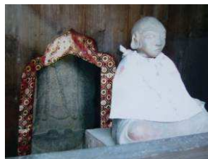
明光寺の首なし地蔵

実は照見・初瀬が信仰していた「地蔵様」が身代りになって助けて頂きました。現在、「明光寺」に「首なし地蔵」として安置されています。