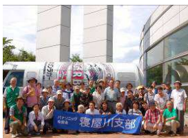
ビール工場にて(2号車)

今年猛暑が厳しく 当日も 36 度を越える暑 さでしたが予定通り実施 できた事に感謝致します。