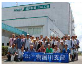
沢井製薬にて(1号車)

今回は、台風の前畿接 近の心配もありました が、当日は、松愛会のパ ワーと運が良く予定を変 更せずに実施できた事を 感謝しております。