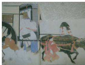
とのさまとの出会い