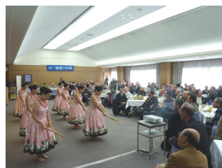
フラダンスで最高潮

多くの方が入れ替り踊 られ、若い女性の踊りに 会員の皆様は釘付けにな って見ておられました。 続いて、恒例の「カラオ ケ大会」では、各班代表 が日頃のど自慢を披露 いただき、大いに盛り