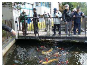
鯉のエサやり体験

水生生物センターでは天然記念物イタセンパラや絶滅危惧種ニッポンバラタナゴ等の希少種の観察や鯉の餌やり体験等、非日常の経験をしました。その後淀川堤防上に移動して五兵衛樋跡の石碑や茨田堤碑や段蔵を順に見学しました。