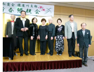
マジック出演の皆さん

続いて、「元氣サークル (太極拳)」から楊式太極 拳の力強く流れるような 演武があり、皆様、健康 増進の観点から熱心に見 られていました。