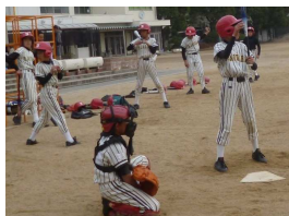
練習中の子供たち

のチームは、六年生9名、五年生9名、三、四年生4名の総勢22名の少人数チームですが、年間50回を超える試合に参加し、各大会で数多く優勝され、野球部会でのチーム勝率トップの戦績を誇っております。 監督としての指導方針は、子供たちの特長をみて、個性を伸ばすことを最重点にしております。 例えば、低学年の子供たちには、ボールに慣れるように指導し、横投げが得意な子供には、無理に矯正せず、それを伸ばす指導を行い、ピッチングで失点しても試合内の再登板の機会を与え、子供たちに自ら考える機会を与えるなど、子供たちの自主性を尊重されておられます。