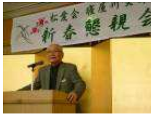
中西支部長の挨拶

今年も早や3月に入り ました。私が支部長に任 まれ、三年が過ぎようとし ています。今回の紙面での