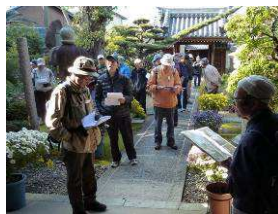
菊の西正寺での解説

水生生物センターでは天然記念物イタセンパラや絶滅危惧種ニッポンバラタナゴ等の希少種の観察や鯉の餌やり体験等、非日常の経験をしました。その後淀川堤防上に移動して五兵衛樋跡の石碑や茨田堤碑や段蔵を順に見学しました。