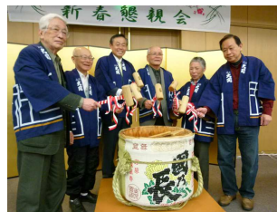
鏡開きで懇親会開始

第2部は、ご来賓・慶 事会員・支部長による鏡 開きと山元副支部長の乾 杯の音頭でスタート。