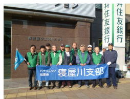
12月香里園駅前清掃

既に昨年末までに公園清掃は一回、駅前清掃は三回実施し、延べ219名の皆さんが参加されました。こうした活動を通じて社会貢献を実感しています。