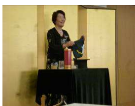
新春懇親会で披露

会員には率先して協力する人、何もしない人、様々な人がいますが誰もがパソコンに興味を持つた人達です。今年も楽しい活動をする予定です。