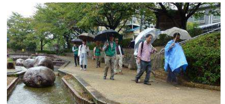
水面回廊 ふれあいの広場

整備された水路沿いを光善寺方面へ散策となりました。雨の中でしたが虫の声を楽しみ、金木犀の香りに癒され、草花など秋の風情を楽しむことができました。