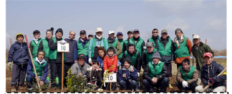
支部活動にて「共生の森植樹祭」参加

植えて7年が経ちました。少しは森らしくなってきましたが、今は竹林の創生、仲間づくりと課題が増えつつあります。あと何年続けられるか? 体力・気力のある限り、今青春真っ盛り! まだまだ夢の途中です。