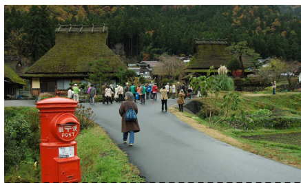
美山かやぶきの里

今回の主たる目的地の南丹市美山町・美山かやぶきの里に向けて林道脇の紅葉を眺めながら移動しました。