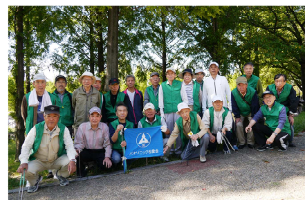
打上川治水緑地参加者(10/5実施)

公園清掃では4月と10月の2回、駅前清掃では6月と合計3回実施しました。(9月駅前には雨天で中止) 延べ152名の参加を頂きました。