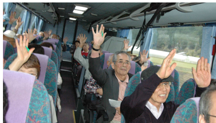
健康クイズの車内風景(1号車)

又、移動中の車内では「到着時間当てクイズ」と日常生活の見直しを促す「健康クイズ」では大きく手を挙げ健康意識を高めました。