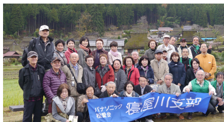
散策前の記念撮影(2号車)

たいという想いが、1993年12月、国の「重要伝統的建造物群保存地区選定」につながりました。