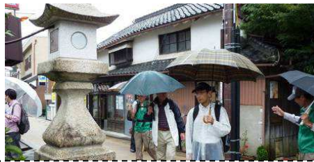
枚方宿 常夜燈前にて

附797間(約1,500m)の宿場の端から端までを巡りました。宗左の辻の道標や常夜燈、本陣跡や鍵屋の建物等の見学等、「枚方宿まちなみ景観建造物」プレートの貼付された建物群の町並み保存活動などをゆっくりと見る事が出来ました。