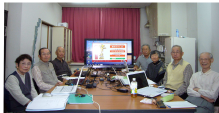
NPC 同好会(パソコンを楽しむ会)

①ラベルマイティの活用②タブレットの検討③画像加工④Windows10導入⑤筆まめ26の導入等。