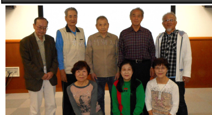
カラオケ同好会の皆さん

カラオケ同好会は再発足して早4年目になりました。当初は数人の事もありましたが、最近は毎回10人前後の参加者でカラオケを練習しています。文字通りの猛暑の今年は歌だけでなく、納涼をかねて焼肉屋で鋭気を養いました。上手に歌うには、毎日の規則正しい生活からの積み重ねではないかと思えます。長寿社会といわれている今日、最近の新曲にはタイトルに、100歳をテーマにした曲が、多々発表されています。カラオケを通して、元気に長生きに挑戦していく参加者を募集しています。(世話役11班 嶋田)