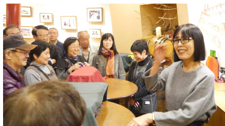
案内役お姉さんとワインの試飲

ワインハウスでは軽快な語り口調の案内役お姉さんの説明の後、ワインを試飲、店内のショップではお土産購入と楽しい時間を過ごしました。