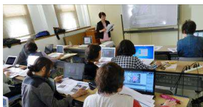
バーディ会 例会風景