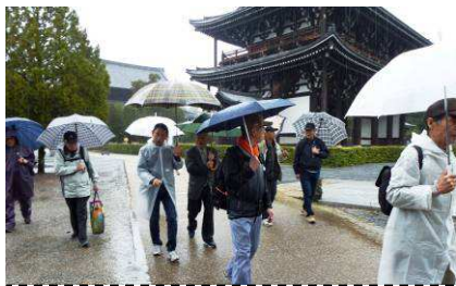
第141回雨の東福寺境内

第141回街道シリーズは4月7日に初参加者2名を含め13名で雨の東福寺駅前を出発。伏見街道を南下し伏見稲荷大社等を経て桜の藤森神社で昼食。雨のため墨染駅にて解散の短縮コースとなりました。