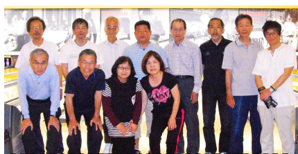
ボウリング同好会 定例活動

ボウリング同好会は2015年5月10日に寝屋川ボウルバロンを活動拠点として会員20数名で第一回目の活動を開始しました。毎月第一土曜日を定例活動日とし、会員数も順調に増えつつ同好会活動を進めて来ました。しかし突然の閉館で活動休止に追い込まれましたが、会員さんの活動再開の熱い要望で、ラウンドワン守口店に活動拠点を移し2015年10月3日に定例活動第一回目を再開しました。以来、和やかに同好会活動を推進しています。健康長寿を願う会員、御家族様の体験や入会をお待ちしています。