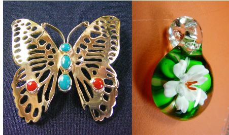
銀細工・ガラス細工作品の一例 また、ガラス棒を卓上バーナで溶かし、

り作品製作に取り組んでおられます。銀材料をデザイン画を基に切り出し、模様打ち、ろう付けから研磨仕上げの大変細かい工程を手作業で行っておられます。