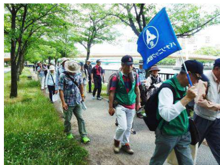
第142回木漏れ日の桜之宮公園

6月2日開催の第142回歴史シリーズは初参加者6名を含め44名の参加者で晴天の京橋駅前を出発。