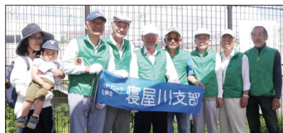
[JR東寝屋川駅参加の皆さん]

6月4日(日)に市内4駅の駅前清掃が実施されました。当支部からは合計38名の方が参加されました。