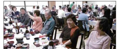
[一休庵での食事風景]

次に豊郷町の酒蔵「岡村本家」の工程や展示物を見学させて頂きました。銘柄「金亀」は彦根藩主より酒造りを命じられ安政元年に創業の老舗です。最後の立ち寄り地は、道の駅「マーガレットステーション」で地元の特産品を買い求め、楽しい時間を過ごしました。帰りはバスで健康クイズを行い、上位者へ賞品をお渡ししました。後半も道路規制で到着時間が20分程、遅くなるも概ね好評な一日でした。