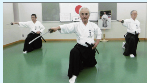
【塾の皆さんの稽古風景です】