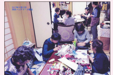
[教室の皆さんの制作風景です]