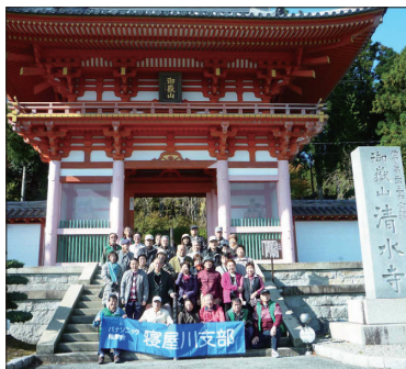
[播州清水寺にて(1号車)]

に開催されました。参加者64名バス2台で八坂公民館前を出発し最初の目的地「西国第25番霊場 播州清水寺」に向かいました。宗派は天台宗で「法道仙人」の開基で創建は推古35年(627年)の歴史ある寺院です。当日は、晩秋の行楽シーズンで高速道路の渋滞がありましたが、ほぼ予定通り到着しました。早速、山門前で集合写真を撮影し、参拝ルート図を全員にお渡しし、30年に1度の根本中堂御開帳と紅葉で色づいた海拔500mの山頂にある境内で散策を楽しみました。