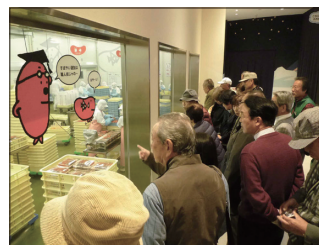
[明太子の工程を見学]

最終の予定地は「めんたいパーク 神戸三田」へ行きました。入館後に説明員から明太子に関する概要説明を受け、シンプルな工程の工場見学の後、試食しました。