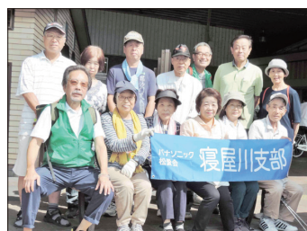
【萱島駅参加の皆さん】

萱島駅では13名、JR東寝屋川駅で13名で、寝屋川市駅で14名の合計57名の方々にご参加いただきました。なお、寝屋川市駅では、17団体308名の参加でした。