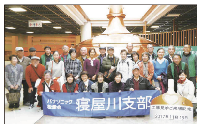
[キリンビアパークにて(2号車)]

午後からは、「道の駅 神戸フルーツ・フラワーパーク 大沢」に行き、皆様思い思いの時間を過ごした後、「キリンビアパーク 神戸」に向かいました。到着後、「厳選した麦・ホップによる素材・一番搾りによる製法へのこだわり」についての説明を聞き、工場見学後は、お待ちかねの試飲があり数種類のビールを味わいました。また、構内の土産コーナーでの買い物を楽しみました。