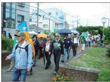
【西三荘ゆとり道をウォーキング】

10月13日(金)に恒例のウォーキング&バーベキュー大会を、開催いたしました。当日は会員並びにご家族・ご友人38名と支部役員 11名の合わせて49名が参加しました。