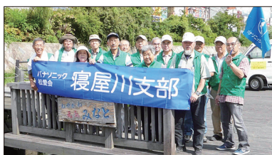
【寝屋川市駅参加の皆さん】

9月3日(日)に市内4駅前の清掃活動が実施されました。夏の猛暑が去り、日が肌心地よく感じられる季節となり、当支部からは、香里園駅で17名、