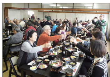
[お楽しみの昼食で乾杯!]

続いて昼食場所である「東条湖グランド赤坂」に向かいました。窓から東条湖を眺めながら地元の