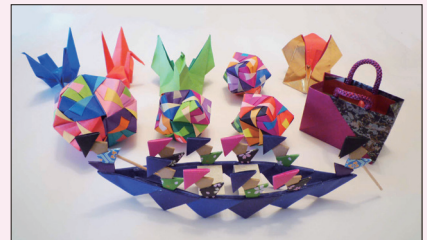
【折り紙の作品(一部)】