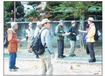
【解説者の宮永さんから説明】

興味深い内容でした。次は「延命地蔵堂」から「山王宮神社」の参拝に行き、集合写真を撮りました。祭神は比叡の日吉神社を勧請されたとのことです。その後、「大峯堂」を通り「聖徳太子堂」と「大神社」を見学し、赤井公園で昼食の休憩を取りました。午後は「太子田樋建設記念碑」を通り「明福寺」「赤井段蔵」から「赤井北野神社」と「宝寿山泉勝寺」を経て、「本念寺」「氷野北野神社」「オカミ神社」を見てから「三箇城跡・切支丹・三箇神社」のキリスト教の名残を見て、帰途に向かいました。