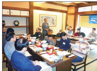
【懇談会での支部長挨拶(第3回)】

の総勢14名の参加で、がんこ寿司にて開催しました。懇談会は前回通りの内容で進めました。対象の多くの新会員の皆さんに出席していただき自己紹介の後、昼食懇談会で大いに盛り上がりました。