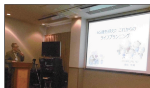
[ライフプランニングの説明]

冒頭、北口支部長より寝屋川支部活動の概要説明と会員へのお願い事項等を報告、定例活動、健康推進活動の紹介を行いました。また、池田地区委員より支部同好会の紹介を行いました。続いて、ファイナンシャル