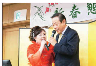
[カラオケでのデュエット]

や掛け声なども入り、賑やかで楽しい歌謡ショーとなりました。そして、次のカラオケタイムでは、2曲のデュエット