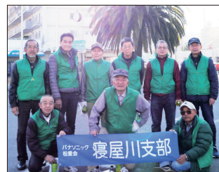
【東寝屋川駅参加の皆さん】

寝屋川市主催の市内4駅前清掃が12月、3月に実施されました。12月3日(日)師走に入り一段と肌身に強く感じられる季節になり、出足も鈍るかななどの思いでしたが、当支部から4駅で55名の方のご参加を