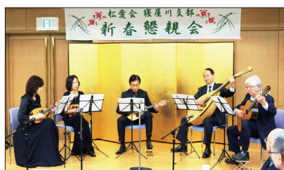
[エレガントなマンドリンの演奏]

今回は、第一部のイベントにマンドリン演奏を企画し、関西在住の14名のグループ「アンサンブルエル」様の中から5名のメンバーに出演いただき、繊細で美しい音色で歌謡曲やポップスそしてクラシックを織り交ぜて計10曲を演奏いただきました。皆さん熱心に聞き入り、アンコール曲終了後は盛大な拍手で感謝を表しました。