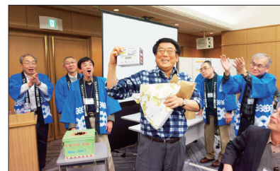
[お楽しみ抽選会で大当たり!]

ト曲を会員と歌っていただき、喝采を浴びました。今回のカラオケタイムは、各班からの会員代表による計12曲で、さながら班対抗のカラオケ大会となり、非常に楽しい時間となりました。続いて恒例のお楽しみ抽選会を開催しました。今回は防災をテーマにして賞品を準備し、千本引きによる抽選を行いました。皆さん、当選のたびに歓声が上がり楽しい抽選会となりました。