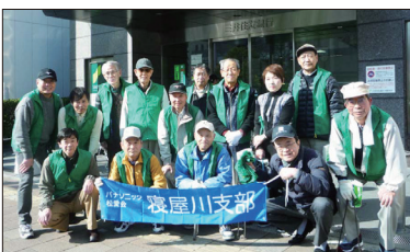
【香里園駅参加の皆さん】

いただきました。全体では636名で、寝屋川市駅307名、萱島駅45名、東寝屋川駅110名、香里園駅174名でした。