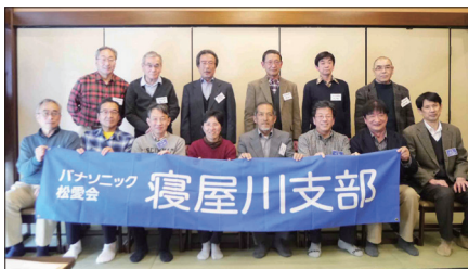
【第3回ご出席の皆さん】

新会員の皆さまの今後のご活躍をお祈りすると共に、ご都合がつく限り、支部行事への積極的なご参加をよろしくお願ひ申し上げます。