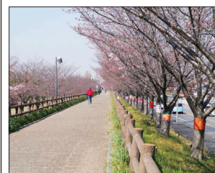
【打上治水公園(2017.4.3撮影)】

寝屋川支部では、支部ホームページに掲載する「寝屋川の一枚」の写真・絵画を募集しております。ジャンルは問いませんので、お薦めがございましたら各地区委員または支部ホームページの会員ページのメールアドレスへ