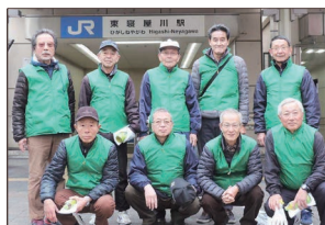
〔JR東寝屋川駅参加の皆さん〕

皆様方のご参加により、ゴミの無い綺麗で安全な寝屋川の街作りにご協力をお願い申し上げます。