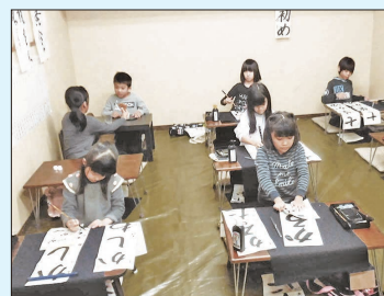
〔書道教室での稽古風景〕

覧会に出品し、入選を機にその先生に指導していただくことになったのが始まりです。爾来、生技本部の書道部入会、師匠へ入門、日本書芸院入会、一科会員昇格、書道教室開設、等々、現在に至っています。五十年以上の書道人生を振り返り、途中で挫折することなく続けて来られたことに幸せを感じる次第です。