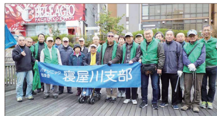
〔寝屋川市駅参加の皆さん〕

協力いただきました皆様に御礼申し上げます。平成年号最後の開催となりましたが、次回、6月2日(日)に予定されております。