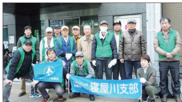
〔香里園駅参加の皆さん〕

3月3日(日)に、寝屋川市主催の市内4駅の駅前清掃活動が実施されました。小雨混じりの少し肌寒い日となりましたが、