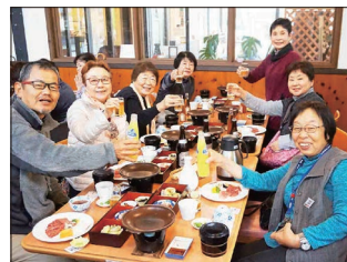
〔お楽しみの昼食で乾杯!〕

山ガーデンで期待の昼食を摂り、出石皿そばや但馬牛の陶板焼に舌鼓をうちました。江戸中期信州上田の仙石氏が国替で出石に移封された時に一緒に来た信州蕎麦の職人が技法を伝え、その後出