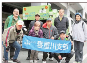
〔萱島駅参加の皆さん〕

大勢の人がご参加頂き、寝屋川市駅で21名、萱島駅で9名、香里園駅で15名、JR東寝屋川駅で9名の合計54名の方々のご参加をいただきました。ご