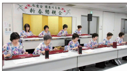
【大正琴の演奏(友弦流枚方の皆さま)】

は会員の心に響くものがあり、大変好評でした。アンコールを含む懐かしい8曲を演奏いただき、大喝采で第一部を終了しました。