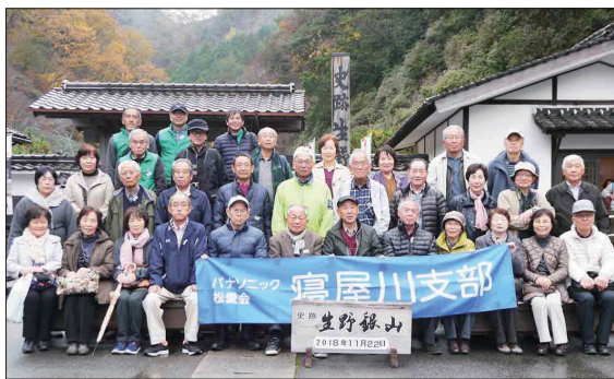
〔生野銀山にて(2号車)〕

そこかしこに現れる江戸時代の人一人通るのがやっとなんて掘坑道を見ながら当時に思いを馳せました。