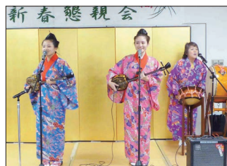
【沖縄三線と唄(琴・みきの皆さま)】

カラオケタイムは各班の代表のエントリーを得てスタートし、今回は「琴・みき」姉妹のお母さまとのデュエットもあり、大いに盛り上がったカラオケ大会となりました。