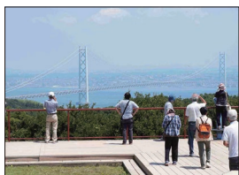
[淡路島公園展望広場]

新寝屋川八景がなじまれています。到着時刻当てゲームで盛上がる中、ほぼ予定通り最初の訪問地ハイウェイオアシス(百景No.1)に到着です。蒸し暑い中でしたが、明石海峡大橋を背景に