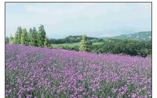
[淡路花さじき 三尺バーベナ]

食を楽しんだ「たこせんべいの里」、三尺バーベナと丘の先に広がる大阪湾の眺望が素晴らしい「淡路花さじき」(百景No.13)を訪れ、無事6時半に帰着しました。