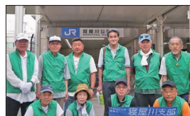
【寝屋川公園駅参加の皆さん】

4駅の駅前清掃が実施されました。当支部からは、香里園駅に16名、寝屋川市駅に17名、萱島駅に10名、JR寝屋川公園駅に10名の計53名の方に参加いただきました。