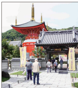
[淡路島七福神八浄寺]

集合写真を撮影し花の谷散策に出かけたりテラスで休憩したりと思い思いに時間を過ごしました。その後「淡路島公園展望広場」(百景No.8)で少