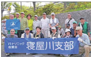
【寝屋川せせらぎ公園にて】

の箇所に3名の計31名の方に参加いただきました。全体では443名の参加でした。ご協力に感謝申し上げます。