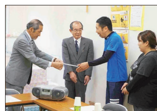
【あかつき・ひばり園にて】

他支部を含む支部会員並びに地域の皆様のご協力により2018年度に収集させていただきましたプルタブ総重量が161kgとなり換金額が10,900円となりました。また、行事開催毎での「ちょこっと募金」にご協力いただきました皆様の浄財が38,232円となり、合計で49,132円になりました。ご協力に感謝申し上げます。