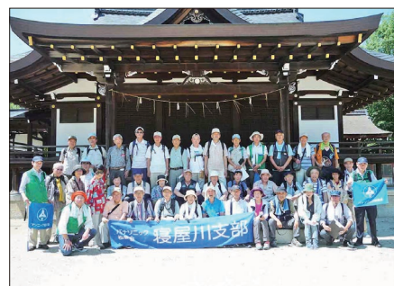
【石清水八幡宮頓宮にて】