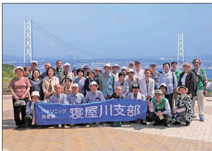
[淡路ハイウェイオアシスにて(1号車)]

6月6日(木)寝屋川支部恒例の楽・遊ねやの会を開催しました。朝8時、梅雨前の晴れ空に恵まれ、参加者73名 バス2台で北淡路の淡路島百景を巡る“大阪湾・播磨灘を一望の旅”に出発です。淡路島百景は、愛着や誇りを持って大切に守られ、文化・自然・歴史の特質をよく顕わした景観として選定されました。寝屋川市では