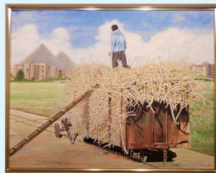
【大阪市長賞「キビを積む農夫」(エジプト)】

これからも、絵画展への応募や数年後には次の個展開催を目指そうと、絵を描くことへの意欲が沸々と湧き上がっています。