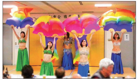
【華やかなベリーダンスご出演の皆さま】

た。エジプトで本場のダンスを学び、大阪府下に数カ所の教室を持ってグローバルに活動をしている「AKIベリーダンス