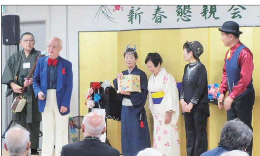
【マジックショーご出演の皆さま】

「マジックショーご出演の皆さま」の5名の方に特徴のあるマジックを次々と披露いただき、瞬時に変化する様に歓声が沸くなど楽しいマジックショーになりました。