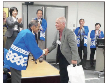
【当選おめでとうございます！】

そして直ぐにお楽しみ抽選会をスタートしました。今回は健康をテーマにして賞品を準備し、出席者の半数の方に当選するようにしました。当選者の名前を呼ぶたびに歓声と笑いで大変楽しい抽選会になりました。