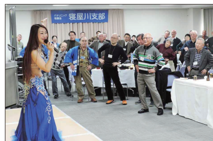
【スタジオ 森代表から健康体操の指導】

スタジオ」の京阪土居教室から8名の方に来ていただき、華やかで情熱的なダンスを披露いただきました。ダンスの途中では、若く煌びやかなダンサーと一緒に腰を動かす健康体操があり、会員総立ちで笑みのこぼれる楽しい大成功の初イベントになりました。