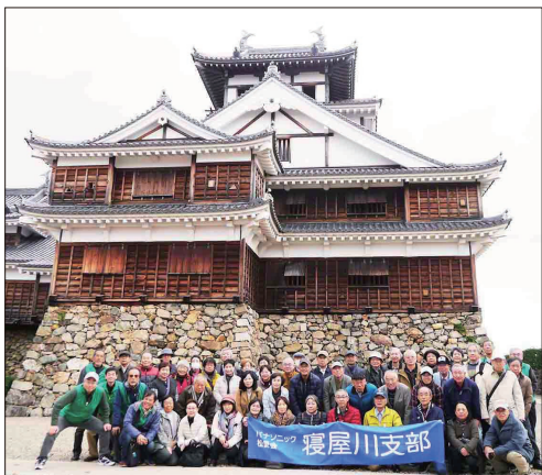
【明智光秀築城の福知山城にて】

52名の会員様の参加を頂き、NHK大河ドラマ「麒麟が来る」の主人公明智光秀が活躍した舞台・丹波福知山を訪れました。光秀に帰順後謀反を起こした