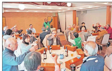
【乾杯!(丹波の奥座敷たかた荘にて)】

波多野秀治が籠もった八上城のある丹波篠山から丹波国に入ります。やがて車窓から見える山並みには黄葉・紅葉が目立ちはじめます。光秀が築いた福知山城の天守閣は三層四階ですが、小天守を従え丘の上に聳え立っていました。息を上げらせ登城した天守閣からの丹後由良川や明智藪の眺望は素晴らしいものでした。足立音衛