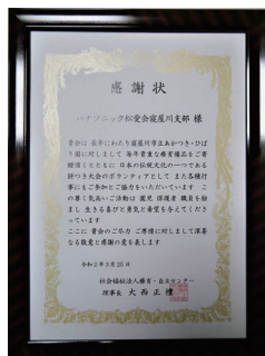
【あかつき・ひばり園からの感謝状】