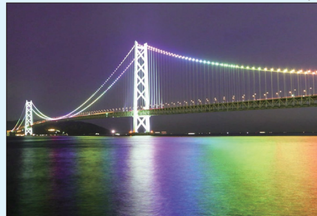
【明石海峡大橋イルミネーション】

自分の作品作りに楽しみを覚えて4年目になります。毎回テーマを与えられ、モノの見方が違ってきました。教室は現地実習や講評を受け、3か月、6回講習で、そのうち1枚が大きなA3にプリントアウト。ぼけてないかピント合せに緊張します。1教室20名(男女半々くらい)、先生は15名ほどおられますが、わたしは同じ先生に教えを乞うてます。先生のおっしゃるには、上達するには、「撮ってみる、印刷して仕上げる、それを人に見せること」だそうです。