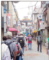
【「売れても古い商店街」を歩く】

櫓の松址に立ち寄り、福島上の天神と言われることもある福島天満宮に参拝し、駄洒落の「売れても古い商店街」で活気づく福島聖天通商店街を通り抜け、浦江聖天の名で親しまれている了徳院にて集合写真を撮り、情緒のある石畳路地近くの海老江公園で昼食を摂りまし