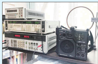
【再生した計測器と自作アンテナで調整中のラジオ】 boy 2000GX」約50

のではなく、古い機器を再生し、音を蘇らせようと思いました。私が入社したのは昭和49年で、丁度オーディオブームが始まった頃で、更にステレオ事業部への配属もあって昔取った杵柄ではありませんが、多少の技術力はありますので、トライを始めました。