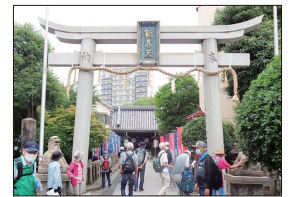
【浦江聖天(如意山了徳院)】

た。昼食後は、松下幸之助創業の地記念碑前で集合写真を撮り、織田信長と本願寺の戦の端緒となる野田城跡の碑を見て、神社の神域拡張記念の石碑に松下幸之助の名が刻まれている