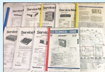
【ネットで探したサービスマニュアル】

年前ラジオの再生です。アンテナは折れ、スイッチは曲り、照明は断線・・・分解し、清掃・電球のLED化・アンテナの交換・調整を行って、当時の状態に蘇らせる事が出来ました。これを皮