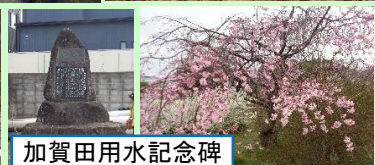
加賀田用水記念碑