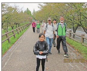
【打上げ治水緑地を農園に向けて】

ウォーキング芋掘りの当初開催日から雨天順延となった1週間後の10月26日(土)今にも泣き出しそうな曇天の中ウォーキング隊(大人10人、子供1人)は午前9時35分に京阪寝屋川市駅前ロータリーを寝屋観光農園を目指し出