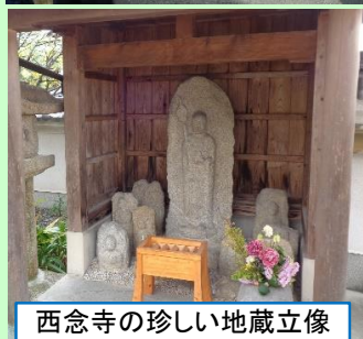
西念寺の珍しい地藏立像