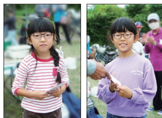
【おめでとう! 長さ1位・面白い形で賞】