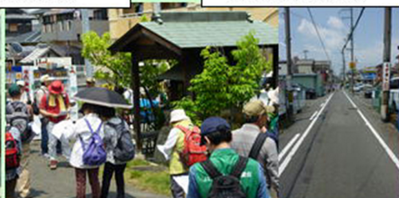
無縁霊の供養堂 教会跡に伸びる直線道かも