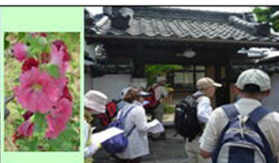
金砂山 光圓寺にて