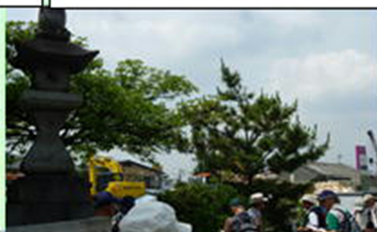
妙見大菩薩常夜燈・砂道跡