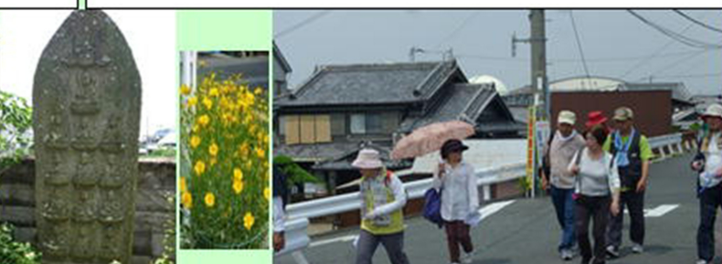
清滝川に沿って 暑い！