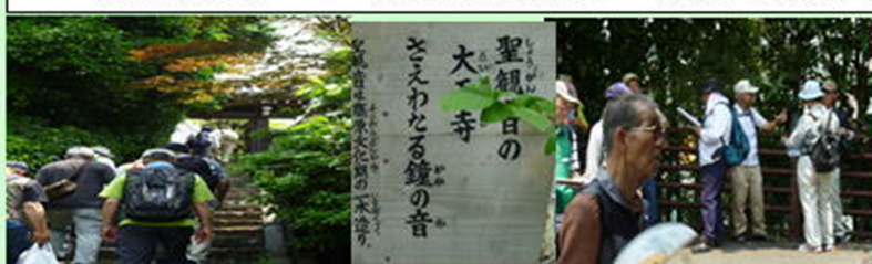
河内三十三所観音霊場 松風山 大正寺にて