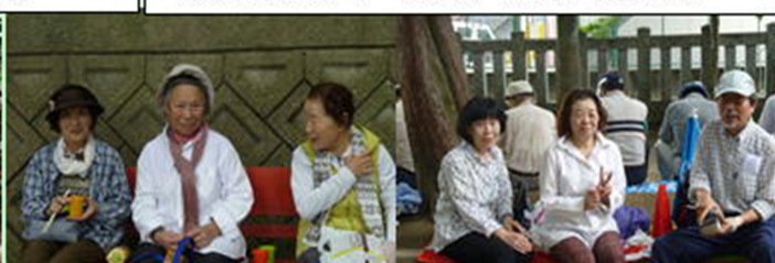
忍岡古墳・忍陵神社にて昼食