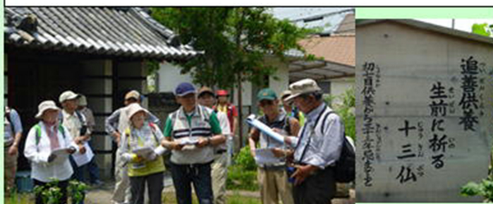
小野山 正法寺にて