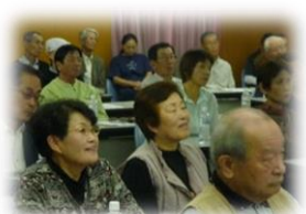
「他人事ではないですね」