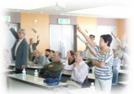
「ジャンケンポンで健康クイズ」