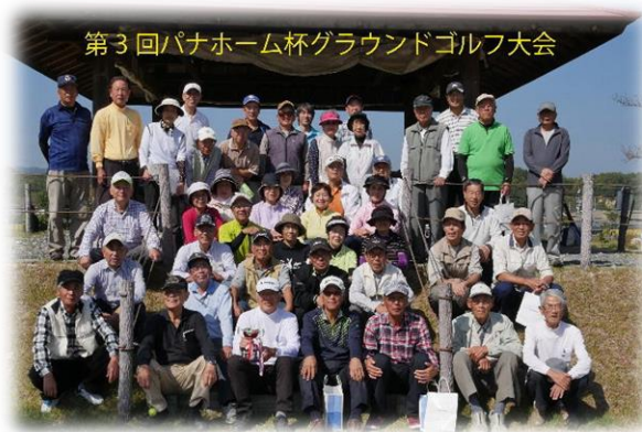
第3回パナホーム杯グラウンドゴルフ大会