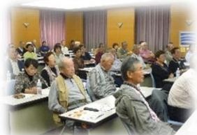
「皆さんの視線は講師へ」