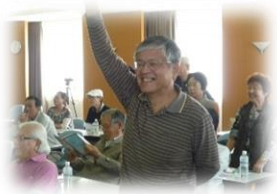
「やっぱり笑顔がいいなあ〜」