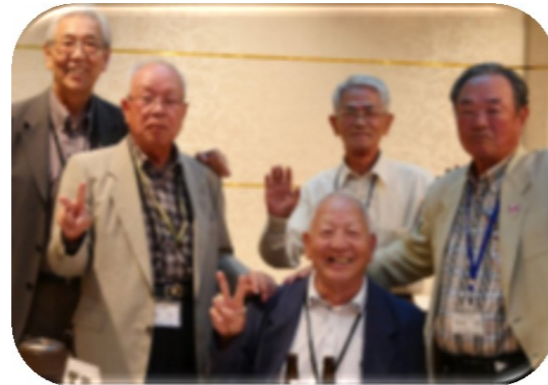
皆さんの笑顔がすばらしい