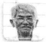
副支部長兼岡山地区担当