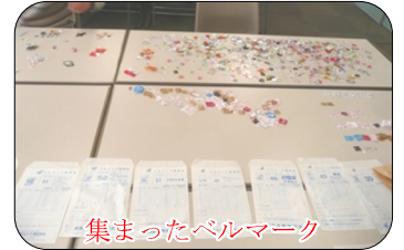
集まったベルマーク