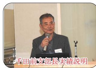
千田前支部長実績説明