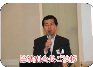
協濱副会長ご挨拶