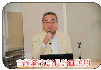
吉岡新支部長計画説明