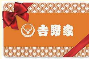
吉野家デジタルギフト 500円ギフト券