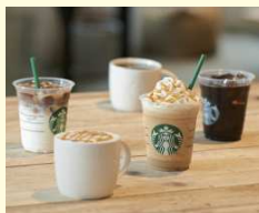
スターバックス ドリンクチケット500円分