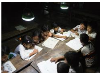
夜間学習で学力向上