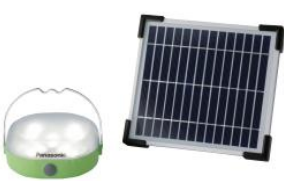
太陽光で充電できる パナソニック製 ソーラーランタン