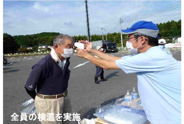
全員の検温を実施