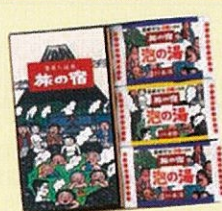
レーヌ特選 旅の宿セット50 *掲載の品は一例です。