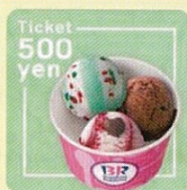
サーティワン アイスクリーム 500円ギフト券