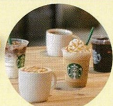
スターバックス ドリンクチケット 500円分

※スターバックス、サーティワンアイスクリーム、ミスタードーナツについては、スマホからの受付のみとなりますのでご了承ください。