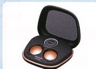
高周波治療器 コリコラン EW-RA500