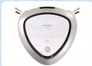
ロボット掃除機 ルーロ MC-R5520-N