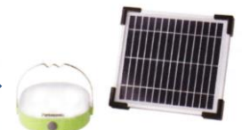
太陽光で充電できるパナソニック製ソーラーランタン