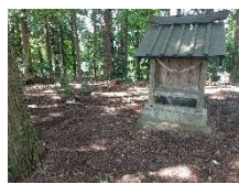
阿野全成終焉の地