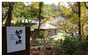
(妙月坊にてランチ)