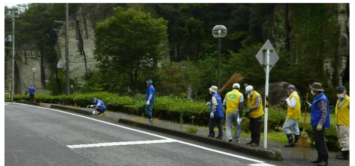
景観公園前の歩道