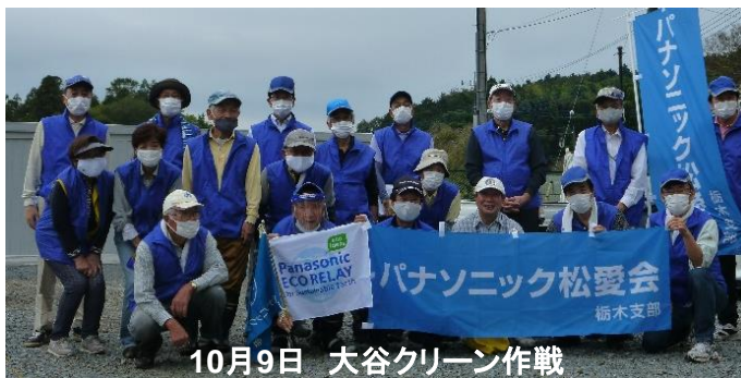
10月9日 大谷クリーン作戦

松愛会栃木支部の2021年度は、コロナ感染が依然収束せず大半の行事が開催できませんでした。前号でご案内した新春懇親会は正月早々のオミクロン株の感染拡大により、栃木県警戒度がレベル2となり中止決定を致しました。2年連続で支部大会、新春懇親会が開催出来ず会員相互の親睦の機会が無かったことは残念でなりません。「10月9日 大谷クリーン作戦」「11月11日 社会見学会(未成線ツアー)」は屋外行事ということもあり、リアル開催が出来ました。「11月23日 女性懇親会」及び各種会議はリモートで開催しました。