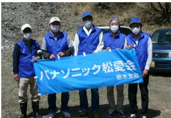
<2021年度の代表参加記録>

尚、「春の植樹デー」は一般参加も受け付けていますので、会員の皆様が個人的に申し込み・参加する事が可能です。