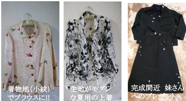
着物地(小紋)でブラウスに!!