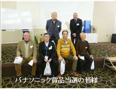
パナソニック賞品当選の皆様