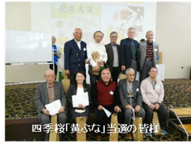
四季桜「黄心」当選の皆様