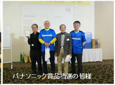
パナソニック賞品当選の皆様