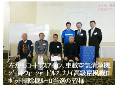
左からコートレスアイロン、車載空気清浄機、 ソニールウォーシャトル、ナイ高級扇風機、 ロボット掃除機ルロ当選の皆様