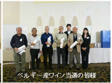
ベルギー産ワイン当選の皆様