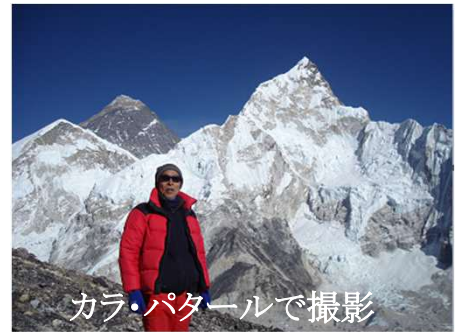
カラ・パタルで撮影

ヒマール、アンナブルナ・ヒマール、ランタン・ヒマール、マナスルなど)5000メートル級の山に登頂。台湾(玉山、阿里山)。韓国(雪岳山、漢撃山、北漢山)。インドネシア(パトゥール山)。ボルネオ島(キナバル山)。素晴らしい自然の変化に感動、記録に残すため、写真撮影を始め多数の写真展を開催してきました。