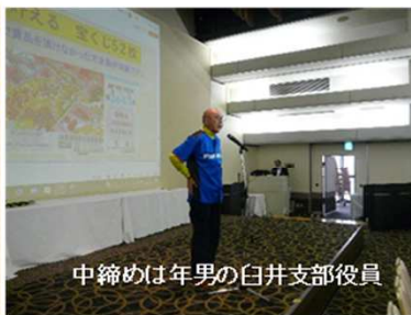
中締めは年男の白井支部役員

これまで賞品を頂けなかった方全員が対象です。 新春運だめし 第2643回 00組 SPECIMEN 012345 見本 ¥200 0123456789 012345678901