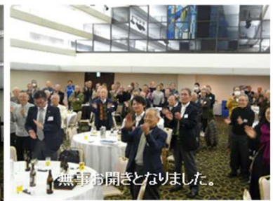
無事お開きとなりました。