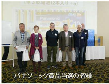
パナソニック賞品当選の皆様