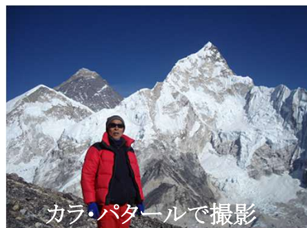
カラ・パタールで撮影

ヒマール、アンナブルナ・ヒマール、ランタン・ヒマール、マナスルなど)5000メートル級の山に登頂。台湾(玉山、阿里山)。韓国(雪岳山、漢撃山、北漢山)。インドネシア(パトゥール山)。ボルネオ島(キナバル山)。素晴らしい自然の変化に感動、記録に残すため、写真撮影を始め多数の写真展を開催してきました。