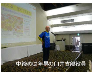
中締めは年男の白井支部役員

夢を叶える 宝くじ52本 これまで賞品を頂けなかった方全員が対象です。 新春運だめし 2645回 00組 SPECIMEN 012345 見本 ¥200