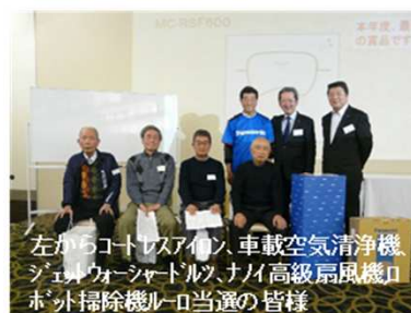
左からコートレスイン車載空気清浄機 ジェムカーシャトルツナイ高級扇風機 ロボット掃除機ルロ当選の皆様