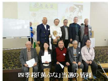
四季桜「黄ふな」当選の皆様