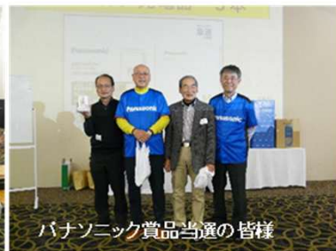
パナソニック賞品当選の皆様