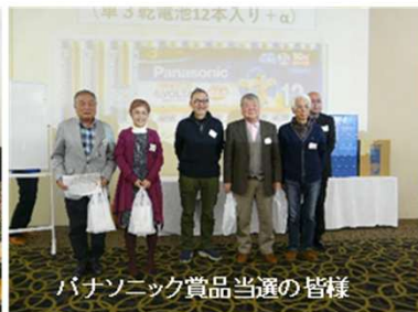
パナソニック賞品当選の皆様