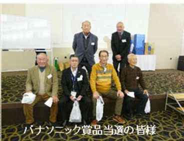
パナソニック賞品当選の皆様