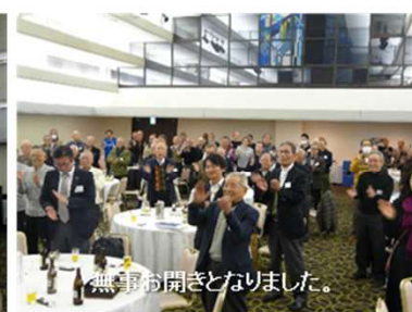
無事お開きとなりました。