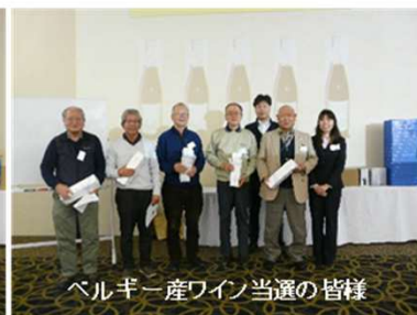
ベルギー産ワイン当選の皆様