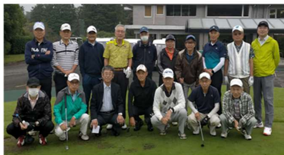
北コース スタートの皆さん