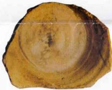
「烽家」墨書土器 (県指定有形文化財)